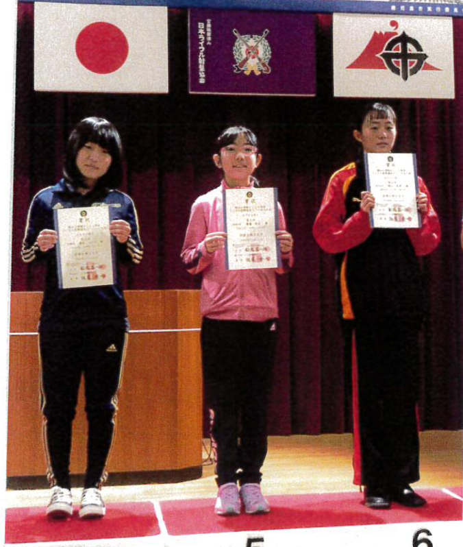
か ご し ま 国 体