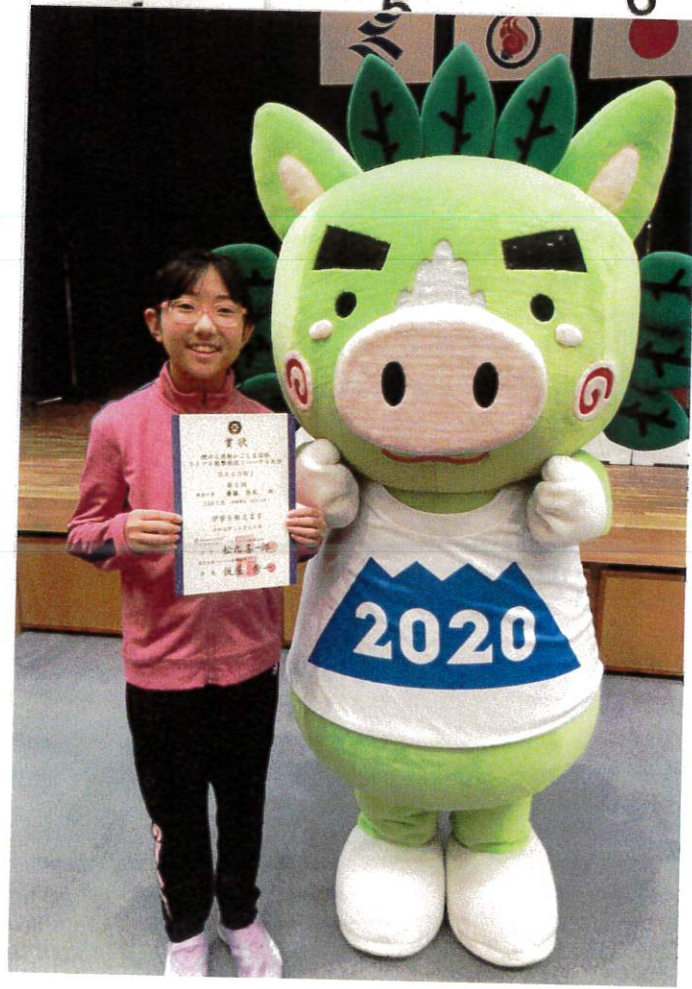
リ ハ ー サ ル 大 会