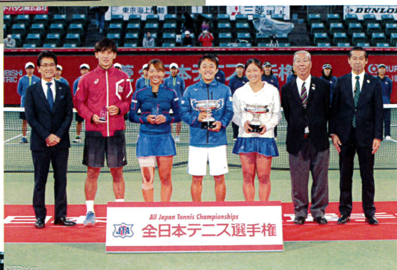
混合ダブルス優勝 表彰式